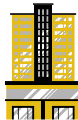
Certains services publics

COLLECTE (LA COMMUNAUTÉ DE COMMUNES BAUD COMMUNAUTÉ ENVIRON 17 000 HAB)